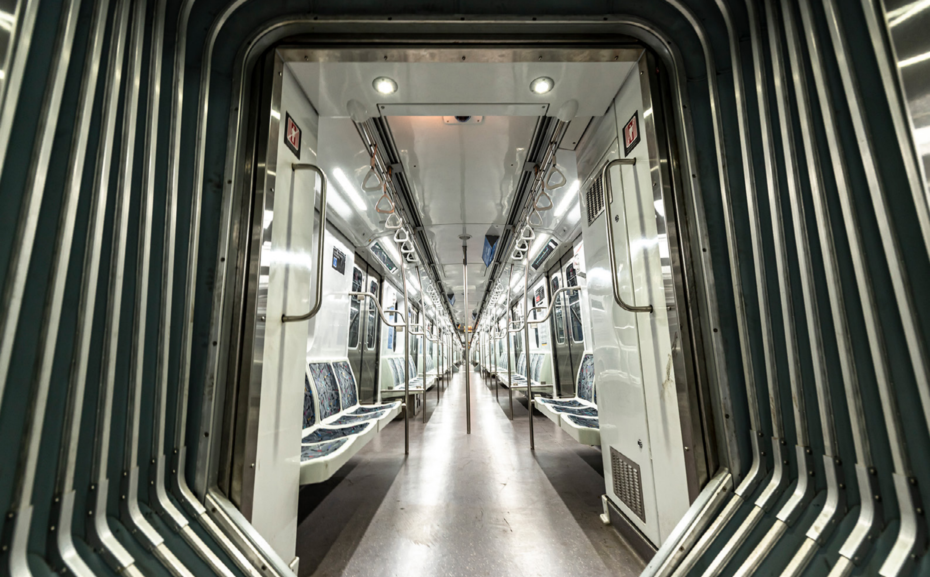
El Subte línea D se encuentra vacío a pocos días de decretarse el Aislamiento Social Preventivo y Obligatorio, en el que se establece que solamente pueden viajar en transporte público aquellos trabajadores considerados esenciales. Ciudad Autónoma de Buenos, domingo 29 de marzo de 2020.