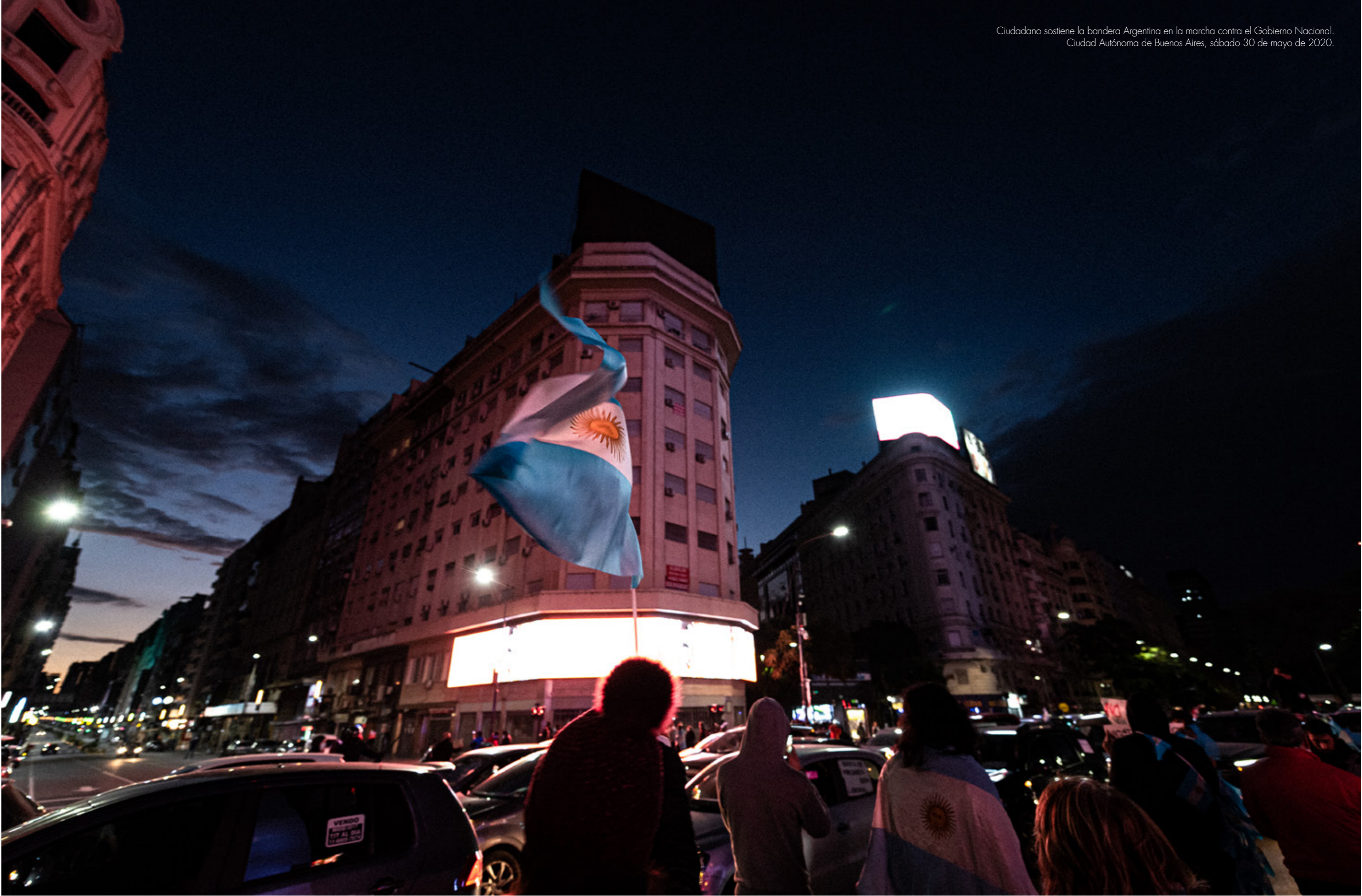
Ciudadano sostiene la bandera Argentina en la marcha contra el Gobierno Nacional. Ciudad Autónoma de Buenos Aires, sábado 30 de mayo de 2020.