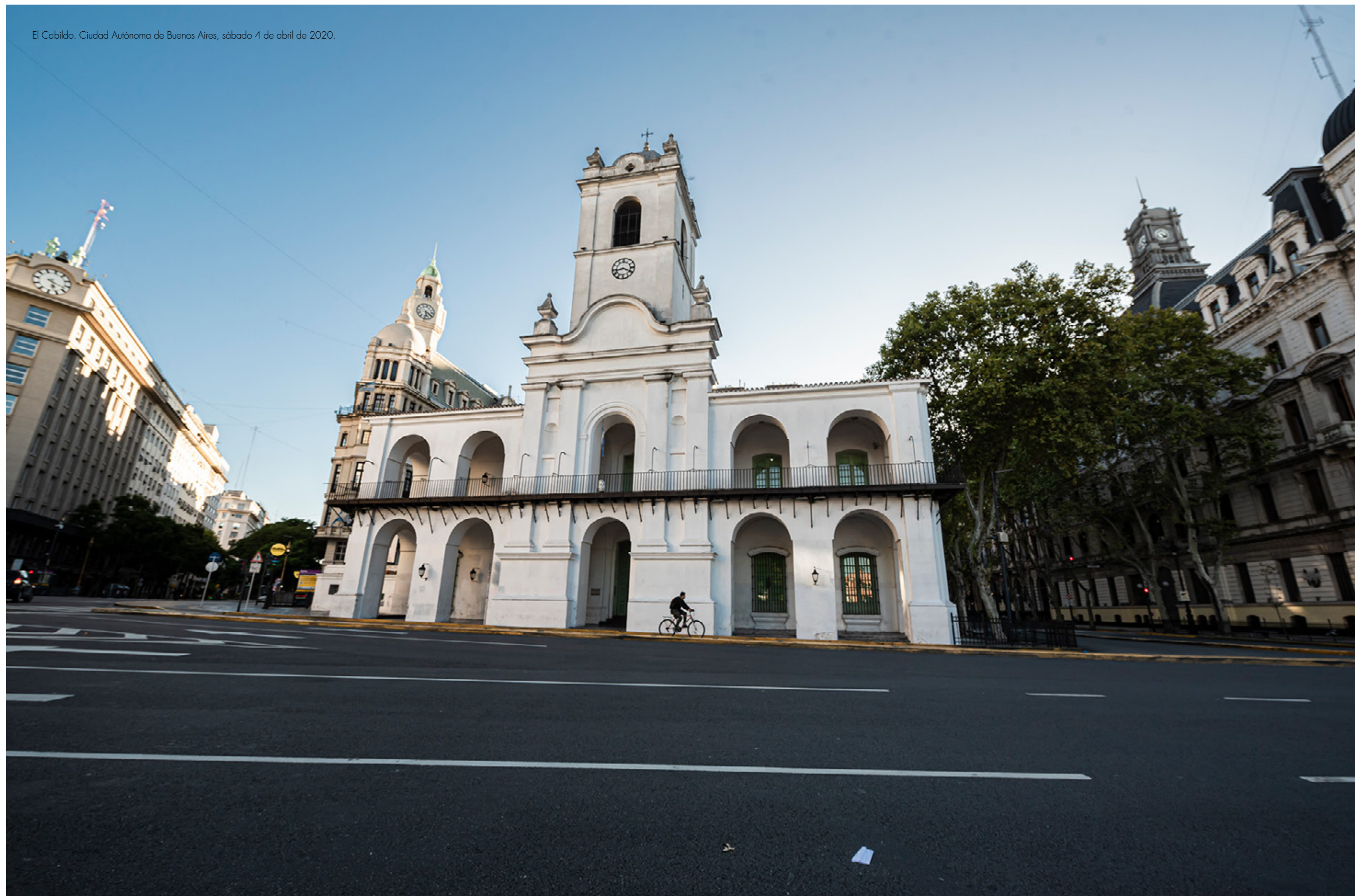
El Cabildo. Ciudad Autónoma de Buenos Aires, sábado 4 de abril de 2020.