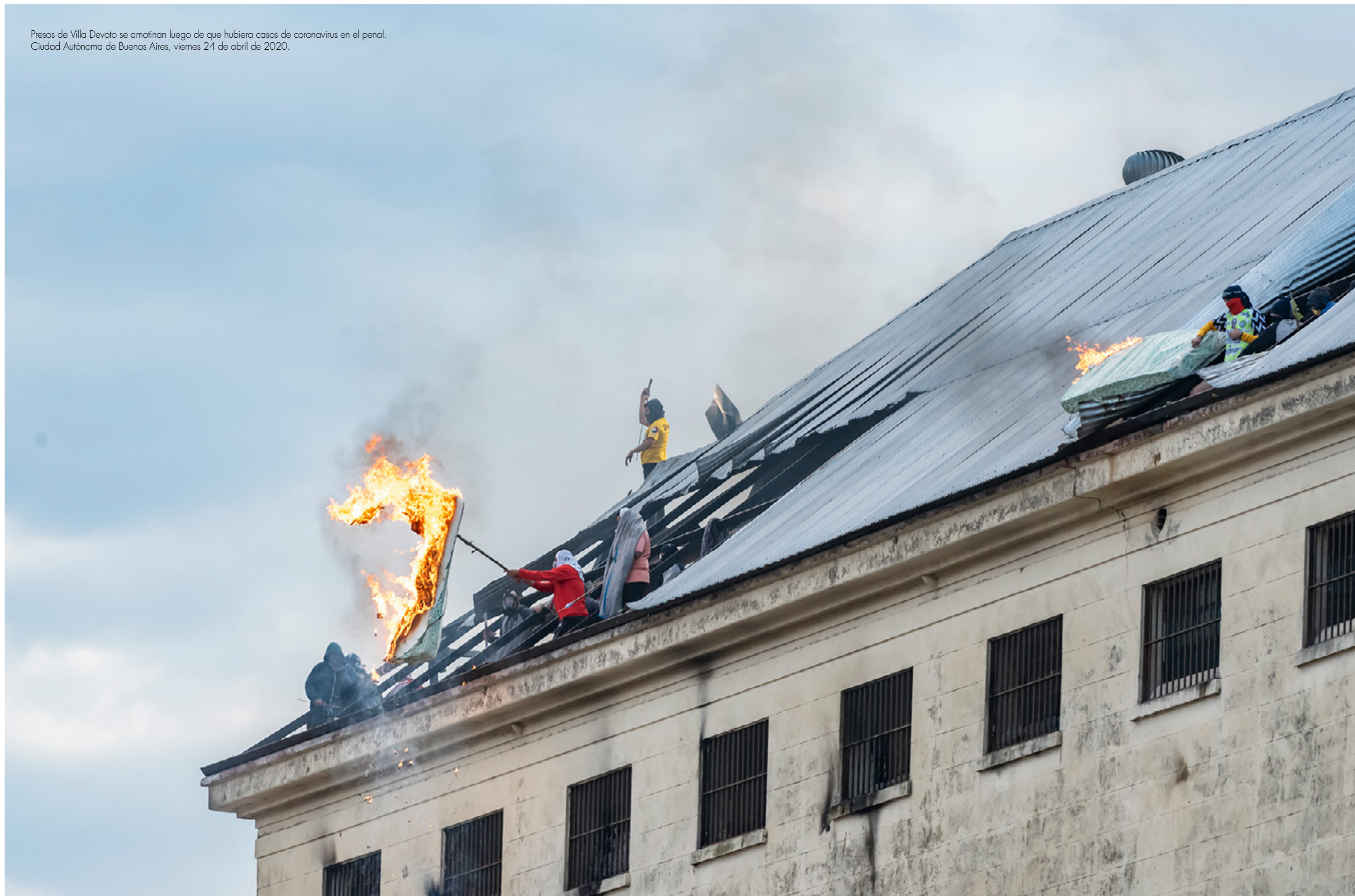
Presos de Villa Devoto se amotinaron luego de que hubiera casos de coronavirus en el penal. Ciudad Autónoma de Buenos Aires, viernes 24 de abril de 2020.