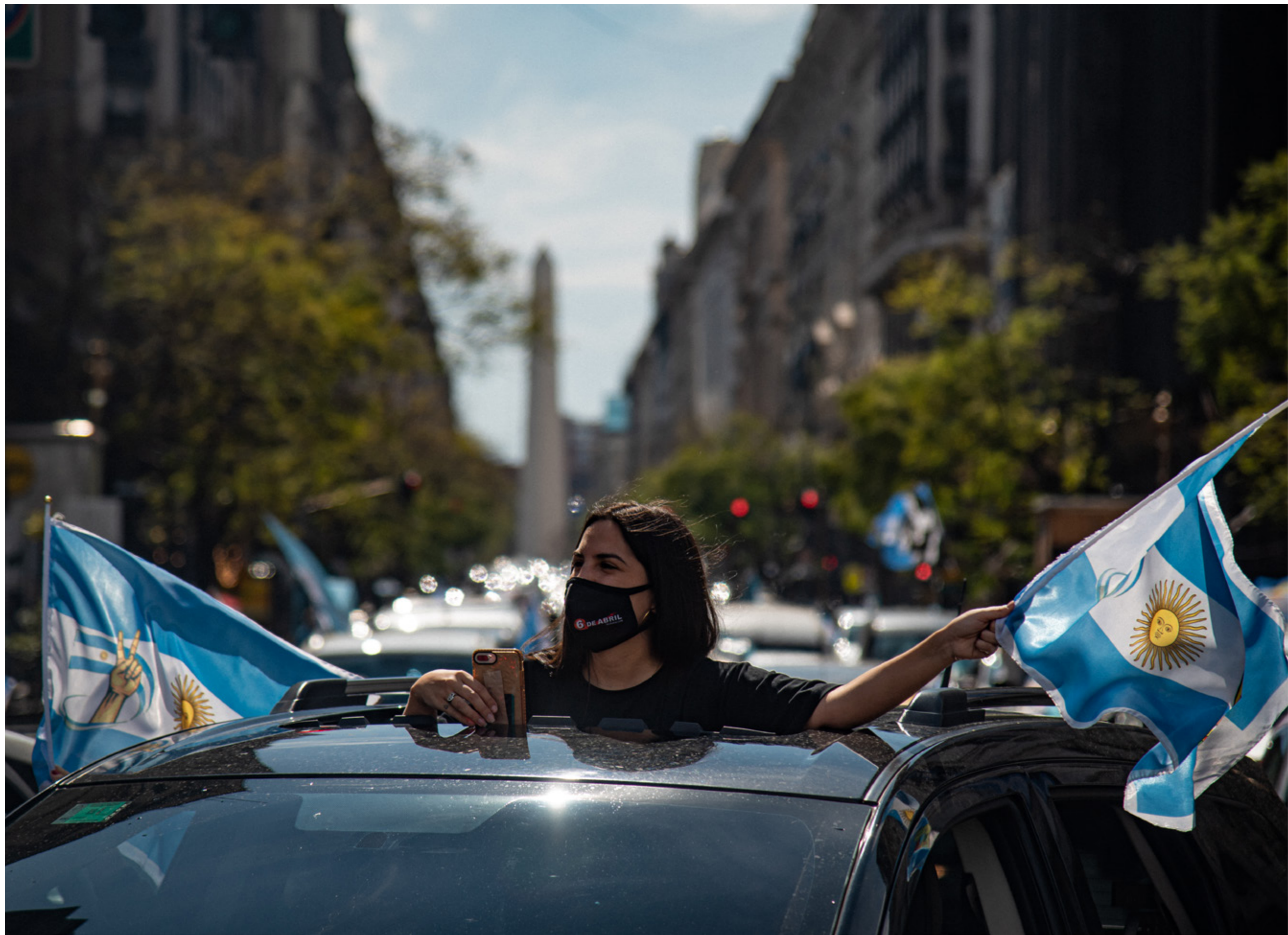
Ciudadana se manifiesta a favor del Gobierno Nacional en la "Caravana de la Lealtad". Ciudad Autónoma de Buenos Aires, domingo 17 de octubre de 2020.