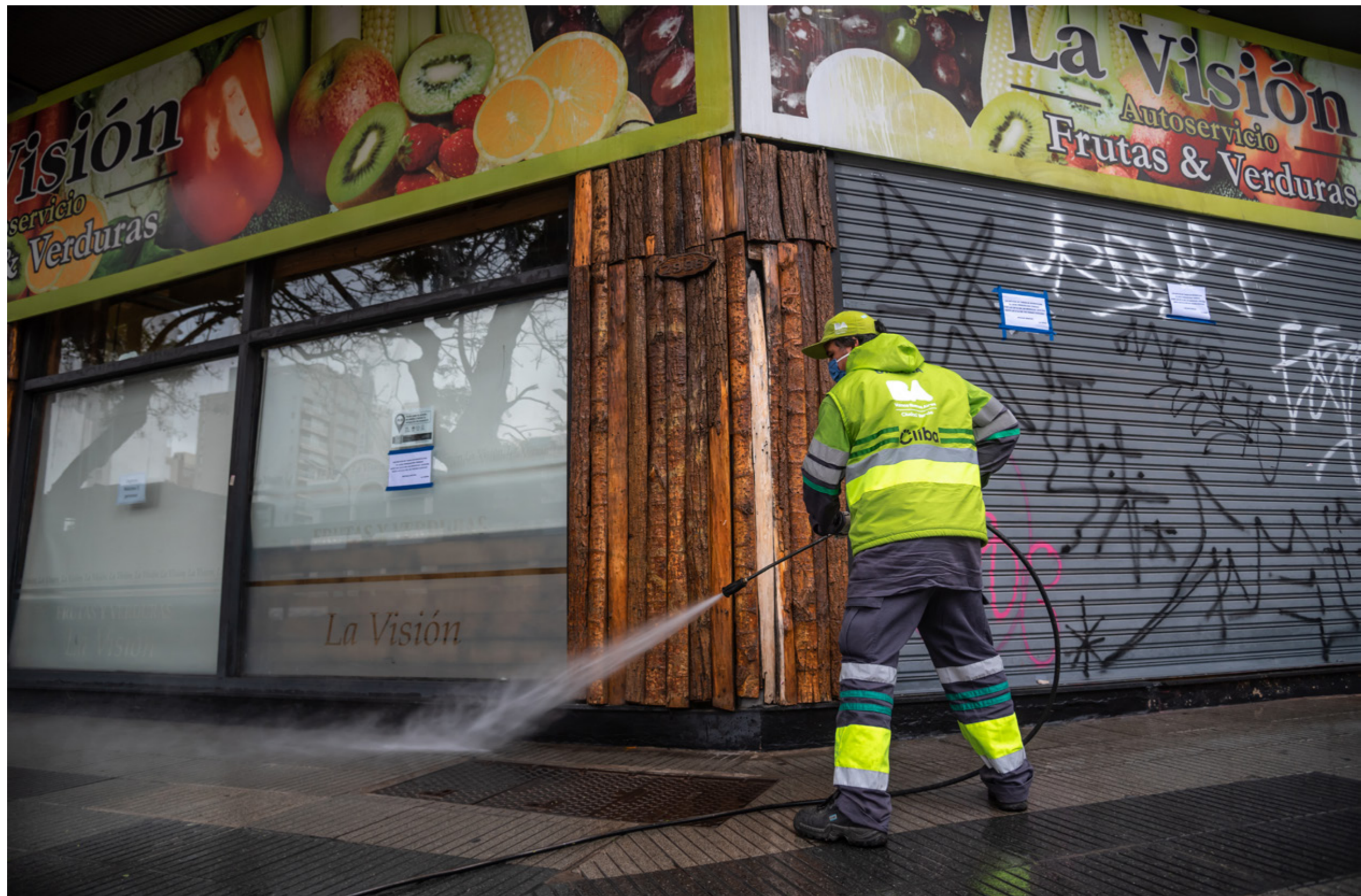
Trabajador esencial desinfecta vereda de una verdulería luego de que hubiera casos de coronavirus. Ciudad Autónoma de Buenos Aires, viernes 22 de mayo de 2020.