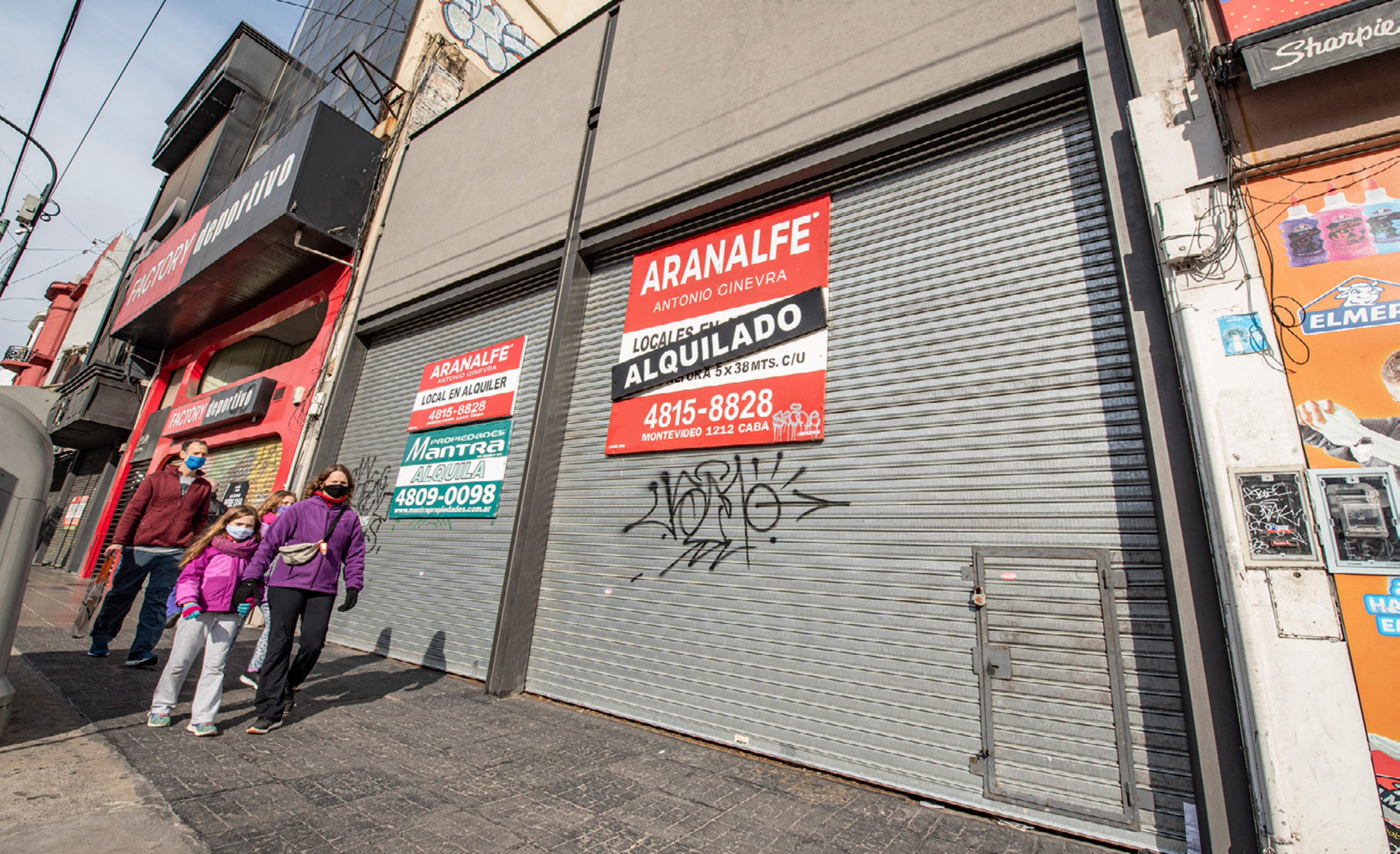
Negocios cerrados en Av. Cabildo en el barrio de Belgrano. Ciudad Autónoma de Buenos Aires, sábado 4 de julio de 2020.