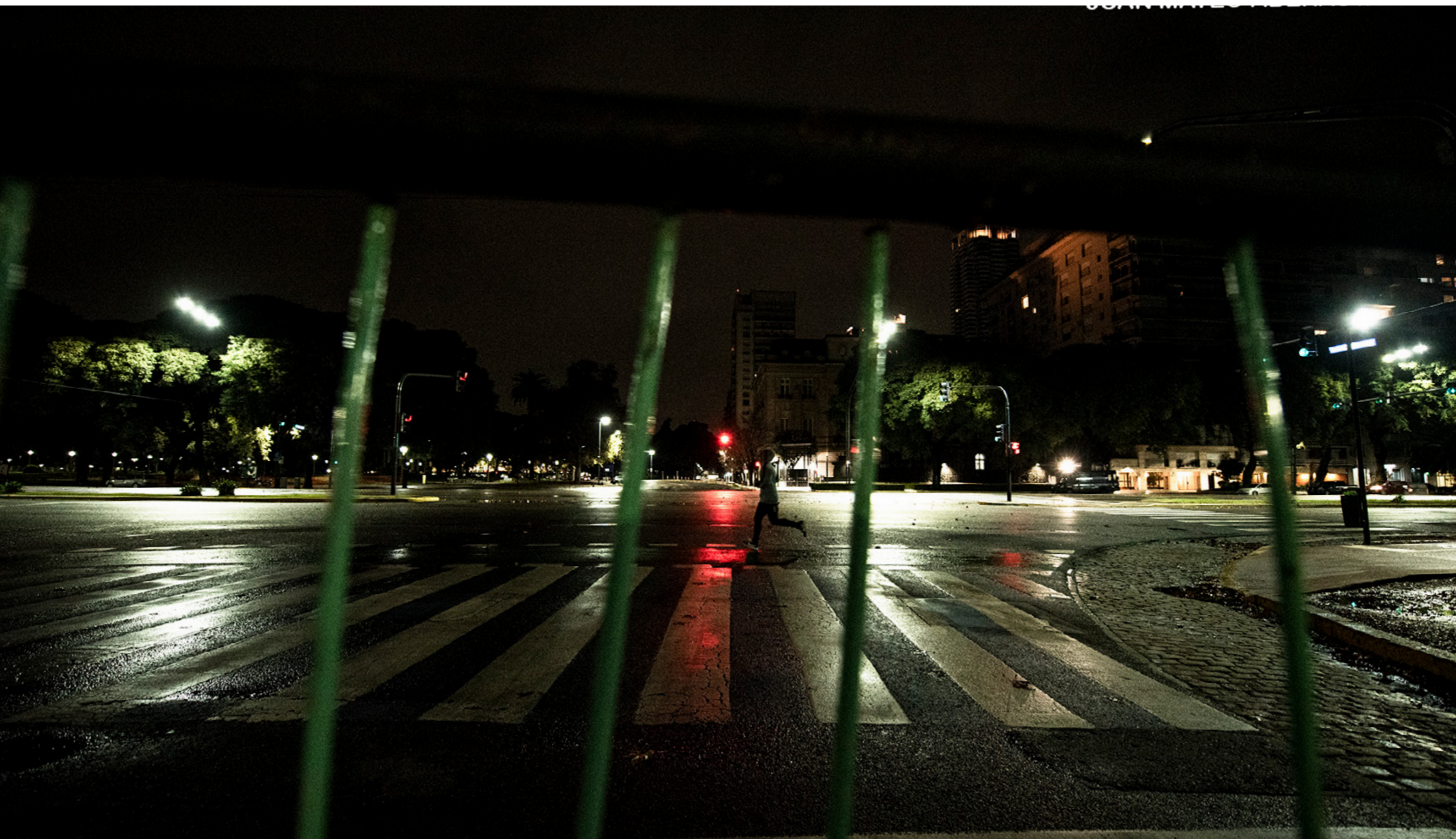
Corredores aprovechan las últimas horas previas a la prohibición de salir a correr. Ciudad Autónoma de Buenos Aires, martes 30 de junio de 2020.