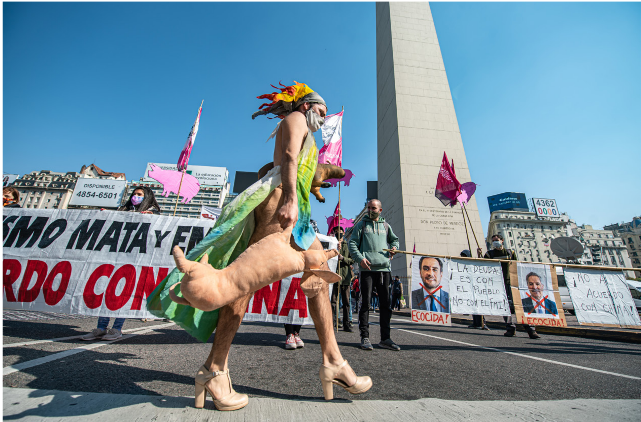
Un manifestante camina con tacos y sostiene un cerdo de utilería en protesta de la asociación estratégica entre China y Argentina en el marco de reclamos contra el extractivismo y la producción de carne porcina en gran escala. Ciudad Autónoma de Buenos Aires, jueves 13 de agosto de 2020.