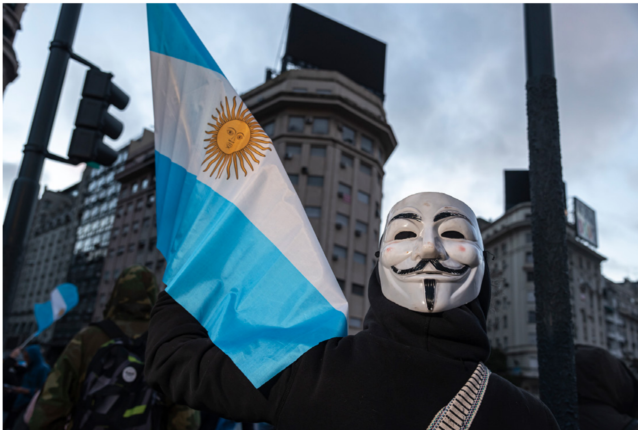
Ciudadano posa con máscara y bandera de Argentina en marcha contra el Gobierno Nacional. Ciudad Autónoma de Buenos Aires, sábado 20 de junio de 2020.