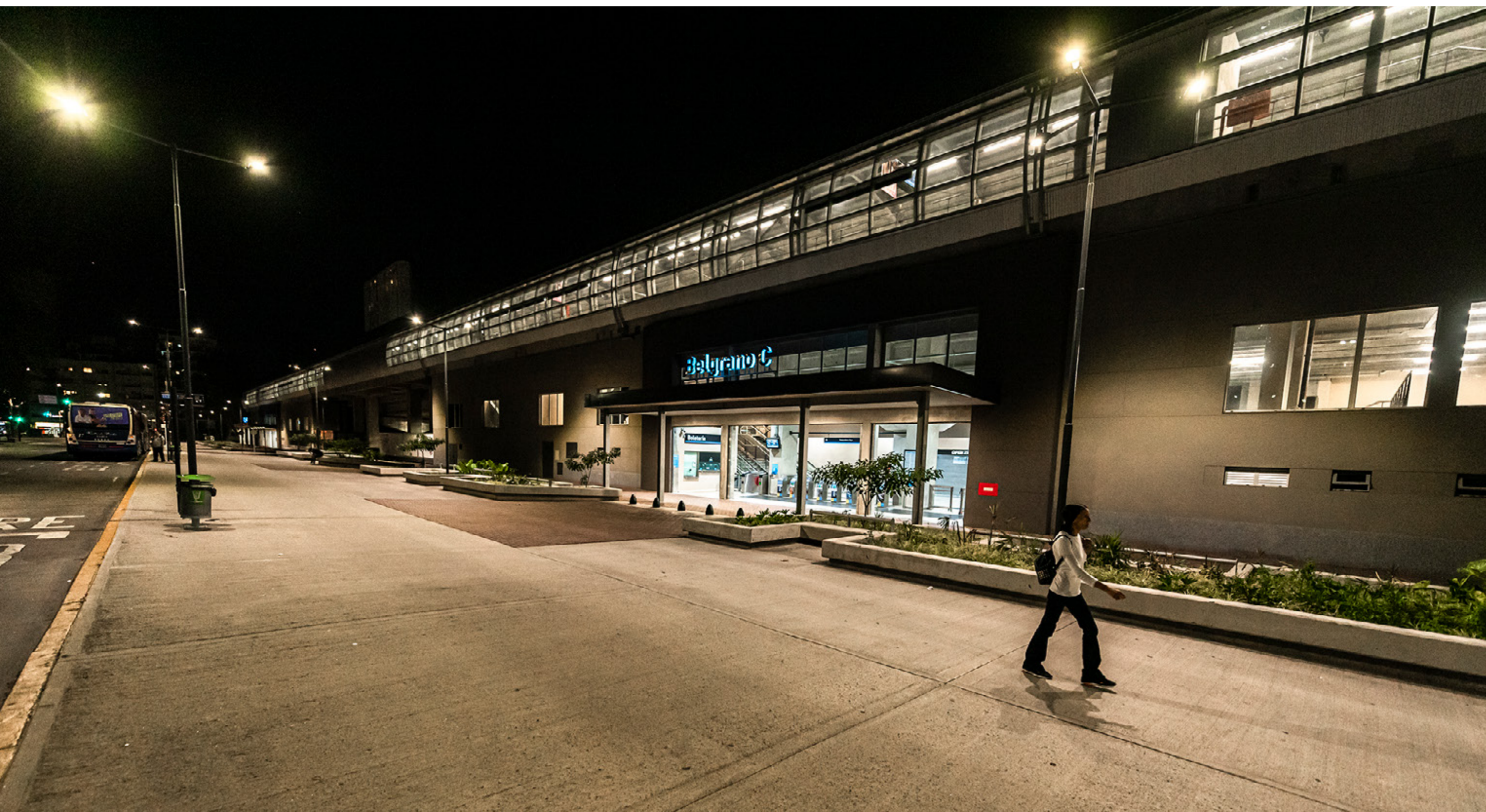
Estación de tren Belgrano C. A partir del decreto 297/2020 Aislamiento Social Preventivo y Obligatorio solo pueden viajar en transporte público aquellos trabajadores considerados esenciales. Ciudad Autónoma de Buenos Aires, sábado 21 de marzo de 2020.