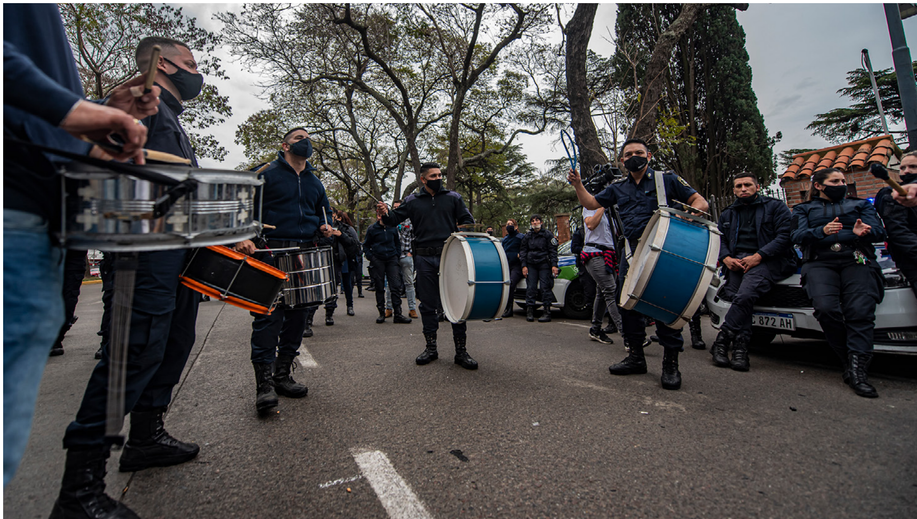
Policías de la provincia de Buenos Aires protestan por mejoras salariales frente a la Quinta de Olivos. Olivos (provincia de Buenos Aires) miércoles 9 de septiembre de 2020.