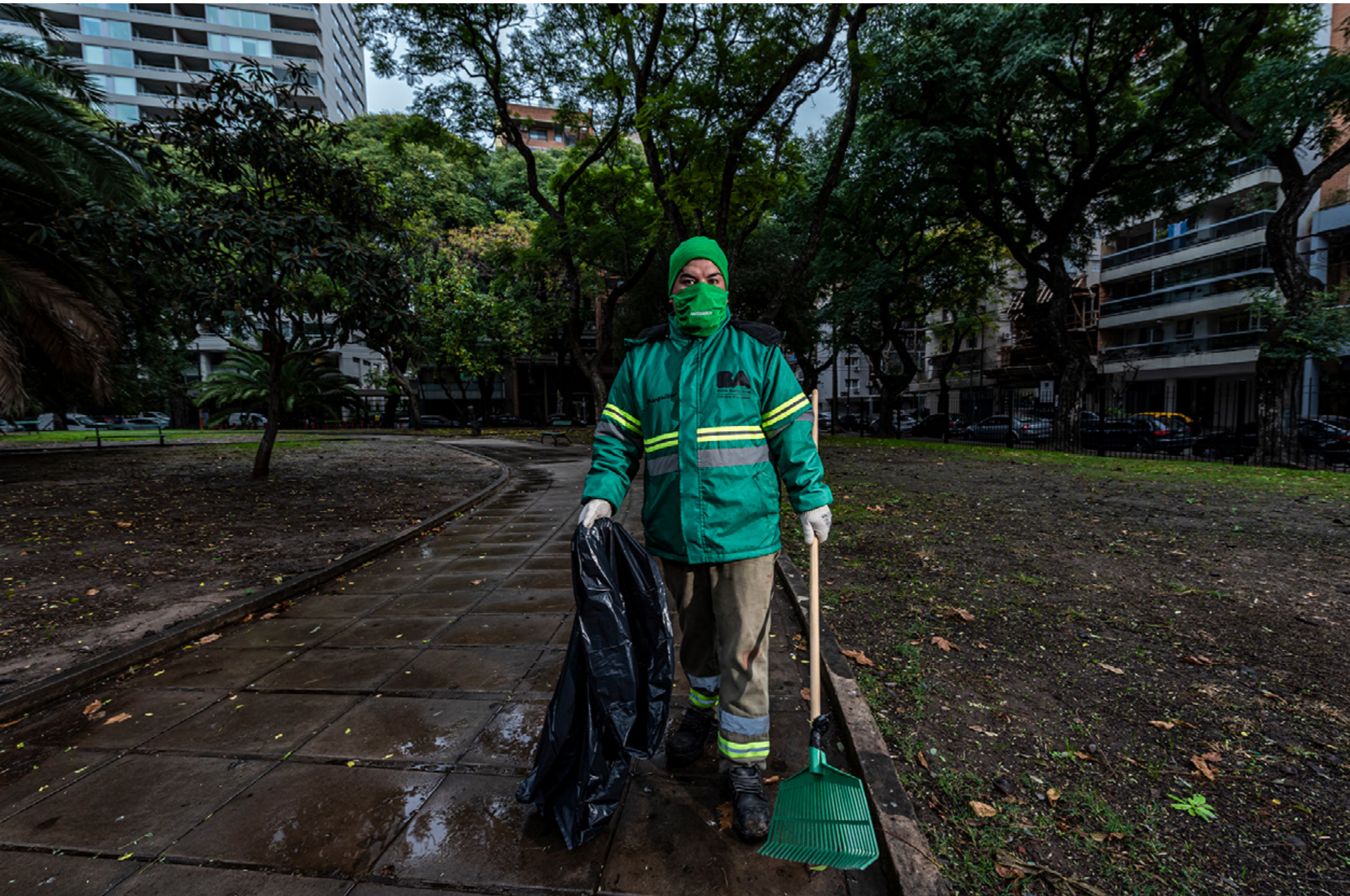
Trabajador esencial. Ciudad Autónoma de Buenos Aires, lunes 1 de junio de 2020.