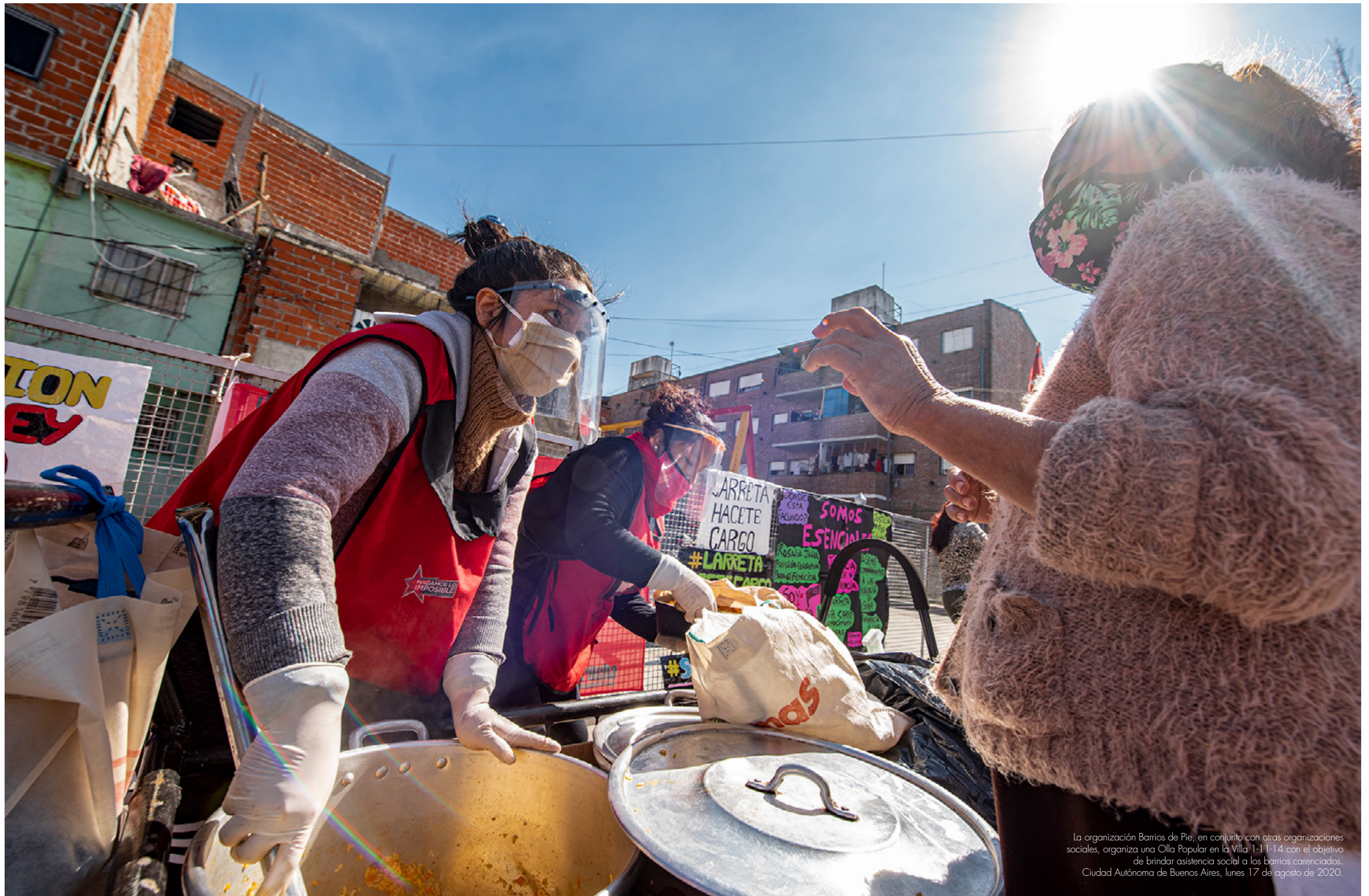
La organización Barrios de Pie, en conjunto con otras organizaciones sociales, organiza una Olla Popular en la Villa 1-11-14 con el objetivo de brindar asistencia social a los barrios carenciados. Ciudad Autónoma de Buenos Aires, lunes 17 de agosto de 2020.