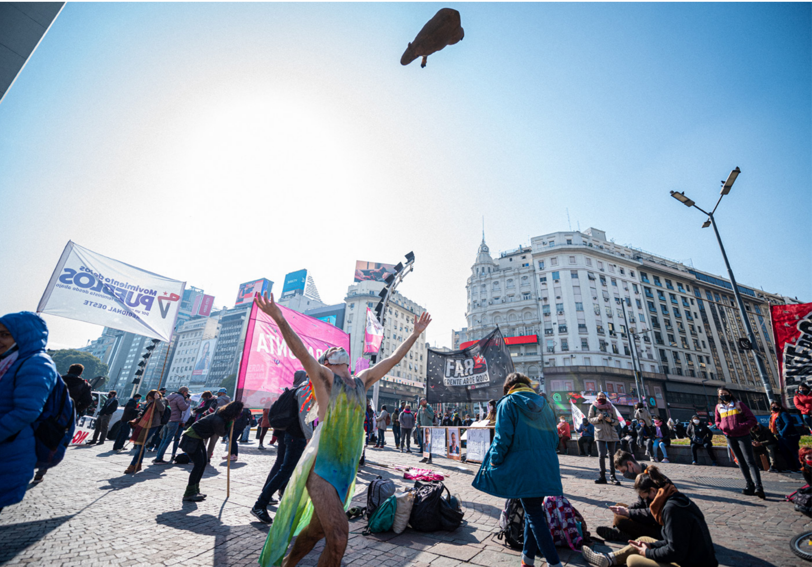
Un manifestante tira al aire un cerdo de utilería en protesta de la asociación estratégica entre China y Argentina en el marco de reclamos contra el extractivismo y la producción de carne porcina en gran escala. Ciudad Autónoma de Buenos Aires, jueves 13 de agosto de 2020.