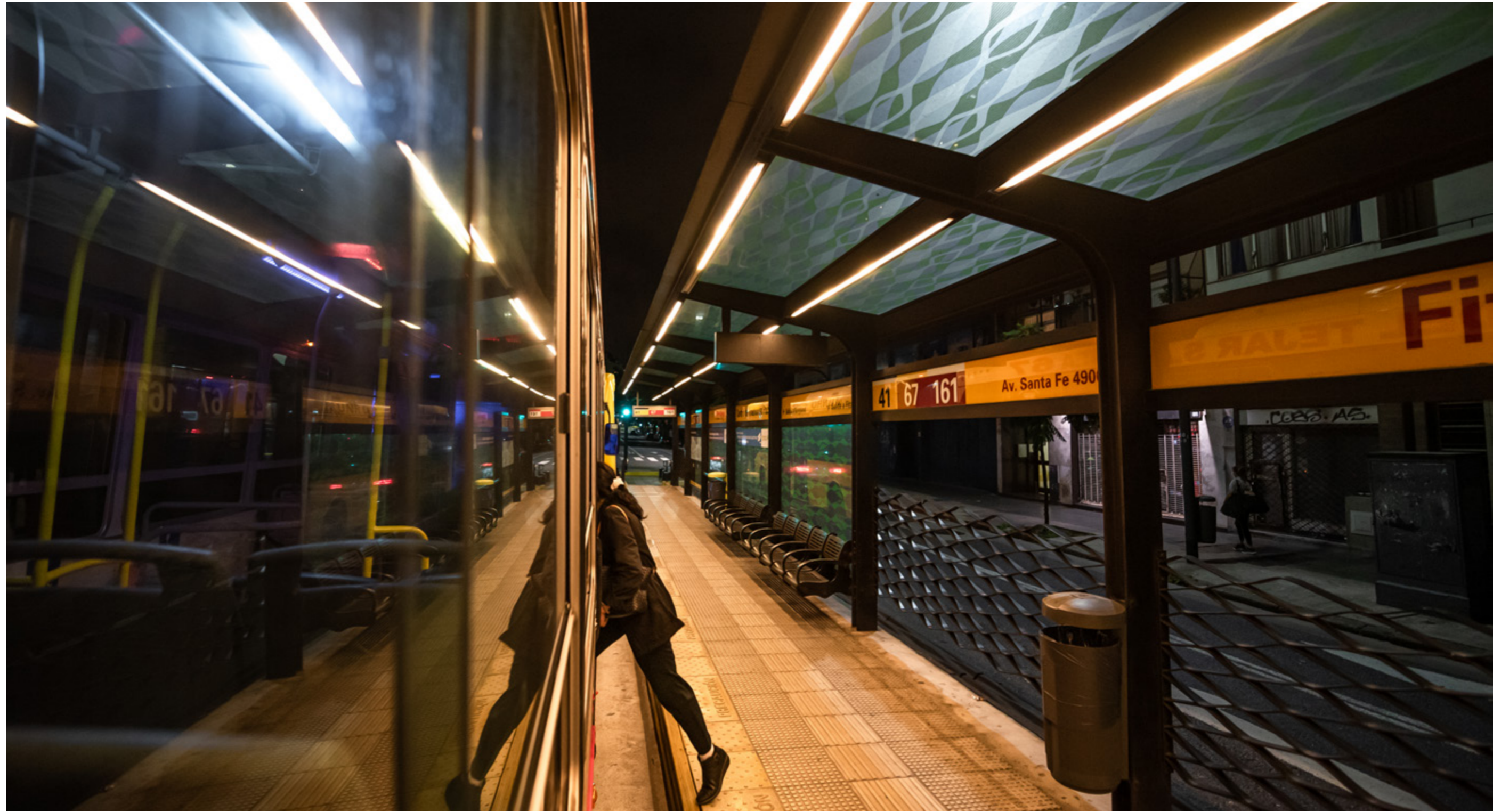
Pasajero ingresa al colectivo de la línea 67. A partir del decreto 297/2020 Aislamiento Social Preventivo y Obligatorio solo pueden viajar en transporte público aquellos trabajadores considerados esenciales. Ciudad Autónoma de Buenos Aires, domingo 5 de abril de 2020.